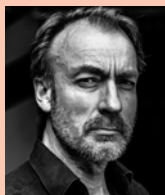
ラーシュ・オイノ (演出家)