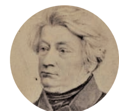
原作 アダム・ミツキエヴィチ