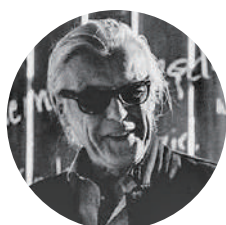
演出 ピョートル・トマシュク