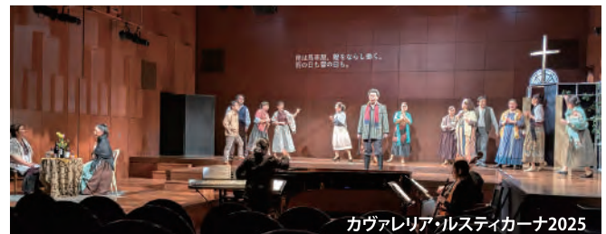
カヴァレリア・ルスティカーナ2025

2008年夏「あえて、小さな『魔笛』」に始まった劇場シアターXのあえて、小さなオペラシリーズは、毎夏の『魔笛』に加え、『カヴァレリア・ルスティカーナ』『フィガロの結婚』『ドン・ジョヴァンニ』…と続き、劇場シアターXのインチメイトな空間で、オペラの醍醐味をたっぷり味わえると好評。